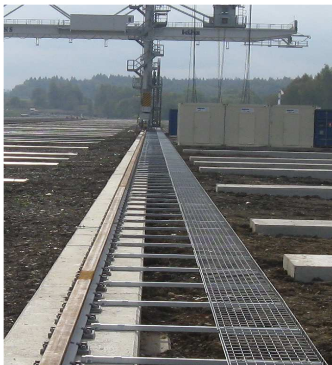
▲ součástí realizace je dodávka kabelového žlabu