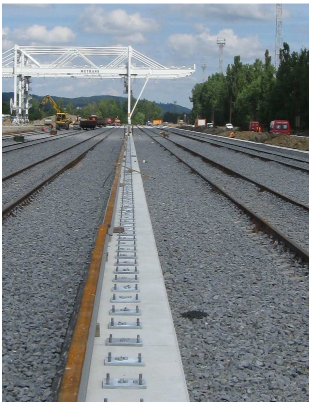
▲ kotvení podkladnic